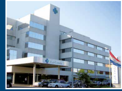
Centro Médico y Sanatorio La Costa