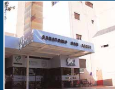
Sanatorio San Roque