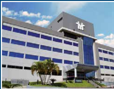
Centro Médico y Sanatorio Santa Julia