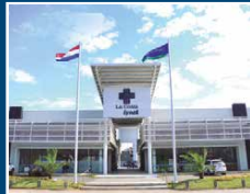
Centro Médico La Costa Lynch