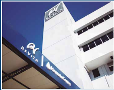
Centro Oncológico Revita