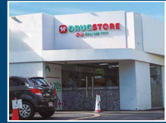
Drugstore Asimed Mcal. López