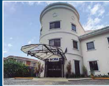
Centro Integral de Rehabilitación Asunción (CIRA)