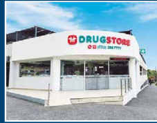
Drugstore Asimed Santa Julia