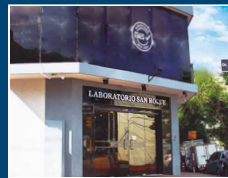
Laboratorio San Roque Centro