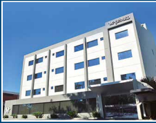
Edificio Corporativo Asimed