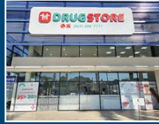
Drugstore La Costa Lynch