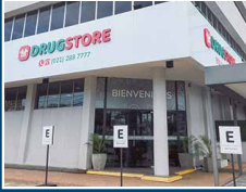
Drugstore Asimed La Costa Artigas