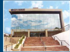
Hospital Universitario San Lorenzo