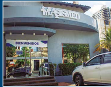
Asimed Oficina Mcal. López